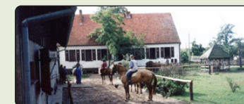
Gårdspladsen i Bucharzewo

Priserne er excl rejse til og fra Polen – det skal her siges at 1000 kr pr. person udover rejsens pris let dækker benzin, bespisning på div motorvejsrest., drikkevarer hele ugen (incl øl og spiritus) og drikkepenge ved feriens afslutning.