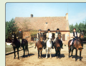
Foran skovhuset i Bota, klar til dagens ridetur