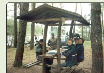
Picknick ved søen