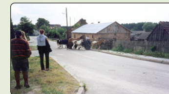
Landsbyliv i Pitka