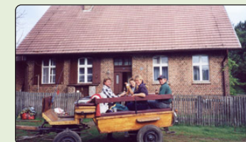
"Afterridning" foran skovløberens hus i Gorgoliza